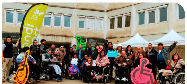
"Venez handiscuter !" le 10 avril à l'UPEC